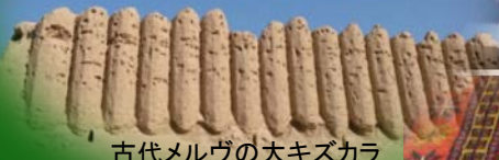
古代メルヴの大キズカラ