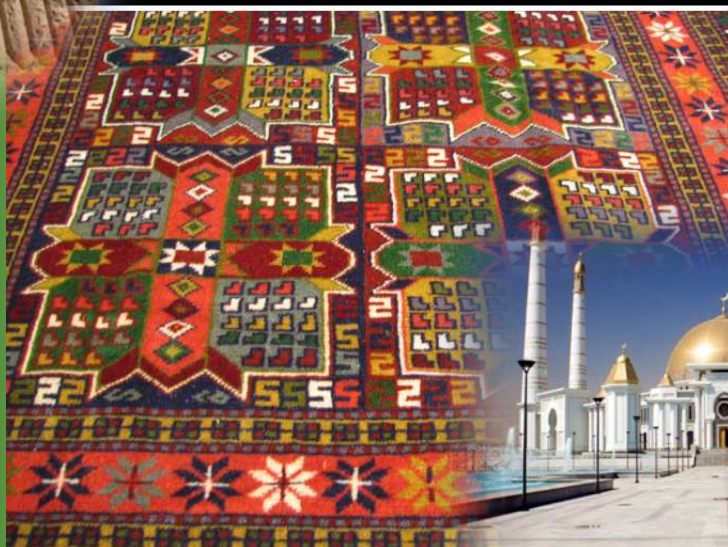
首都アシュガバット