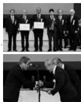
大賞・総務大臣賞 養父市(兵庫県)