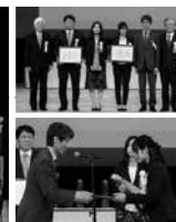
大賞・経済産業大臣賞 株式会社シェルター