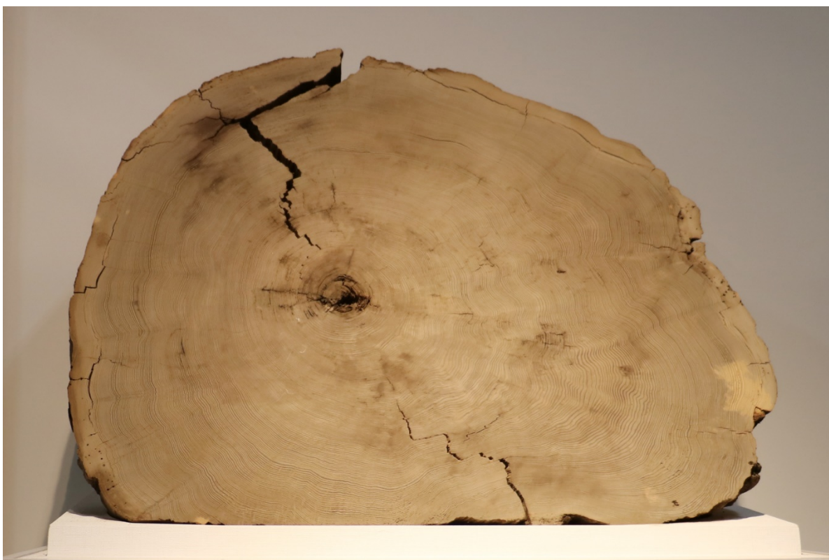
図 1：分析に用いたものと同じ個体の鳥海神代杉（山形大学附属博物館所蔵）。紀元前 466 年に噴火した鳥海山の山体崩壊により埋没した個体を入手した。1 年輪の幅は典型的に 3-5mm と比較的厚く、早材・晩材の剥離が可能となった。

宇宙線生成核種の測定分析から見つけている西暦 775 年、西暦 994 年、紀元前 660 年頃の 3 つの太陽面爆発が仮に現在発生すると、人工衛星の故障や通信障害など、現代社会へ甚大な被害が及ぶと考えられています。今回の研究は、そのような太陽面爆発が数年にわたって立て続けに発生した可能性を示すものです。今後、南極氷床コアのベリリウム 10 分析などから、紀元前 660 年頃のイベントについて、さらに詳しい情報がもたらされることが期待されます。