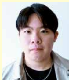
農学生命科学部 地域環境工学科1年

今、弘大生の一員として、自分を信じて率先していく力を身につけたいと考えています。そうすることで、生き抜く術を持ち、活動的な人間となり、助け合える仲間を増やすことに繋げられるだろうと期待します。そしてこの文章を書いているのも、その試みのひとつなのです。