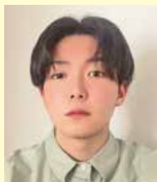
医学部保健学科 放射線技術学専攻1年