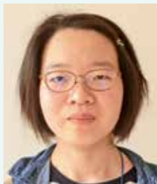
農学生命科学部 生物学科4年