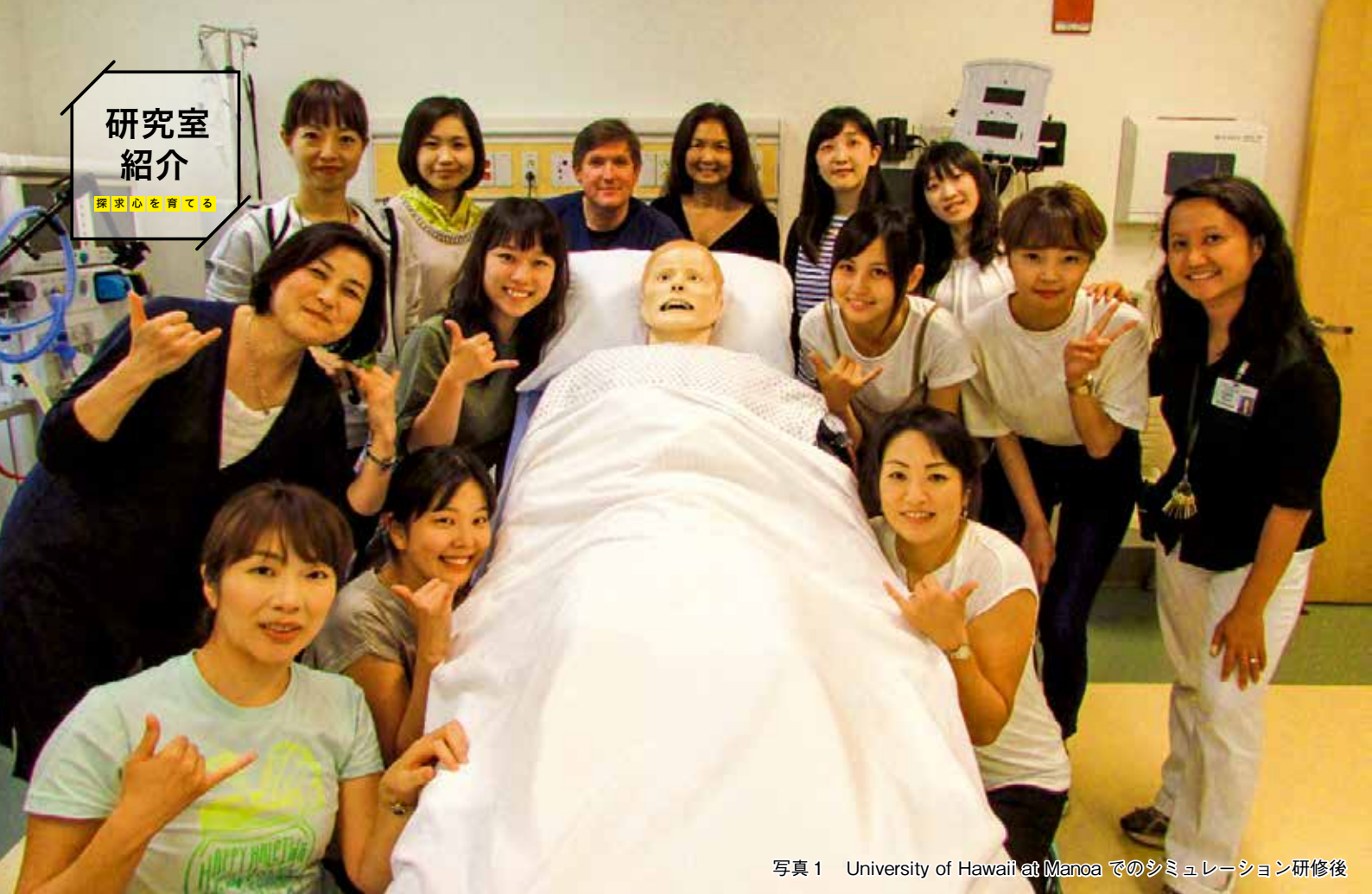
写真1 University of Hawaii at Manoa でのシミュレーション研修後