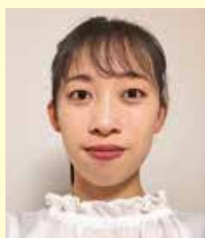
医学部保健学科 理学療法学専攻1年

自由が多い大学生活は大変なことも多いですが、自由が多いからこそできることや楽しめることも沢山あると思います。自分の好きなことや挑戦したいことに没頭することが出来るのは、大学生の特権です。そのため、大学生活では自分の興味のあることにどんどん挑戦していきたいです。楽しく充実した大学生活にするために勉強はもちろん、それ以外のことにも全力で取り組む4年間にしたいと思います。