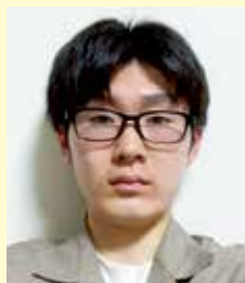
理工学部 自然エネルギー学科1年

私は医用システムコースに進み、将来は医療用ロボットの開発に携わりたいと思い弘前大学に入学しました。希望のコースに進めるよう、1年生の今から勉強に力を入れ、4年間を有意義なものにしたいと思っています。