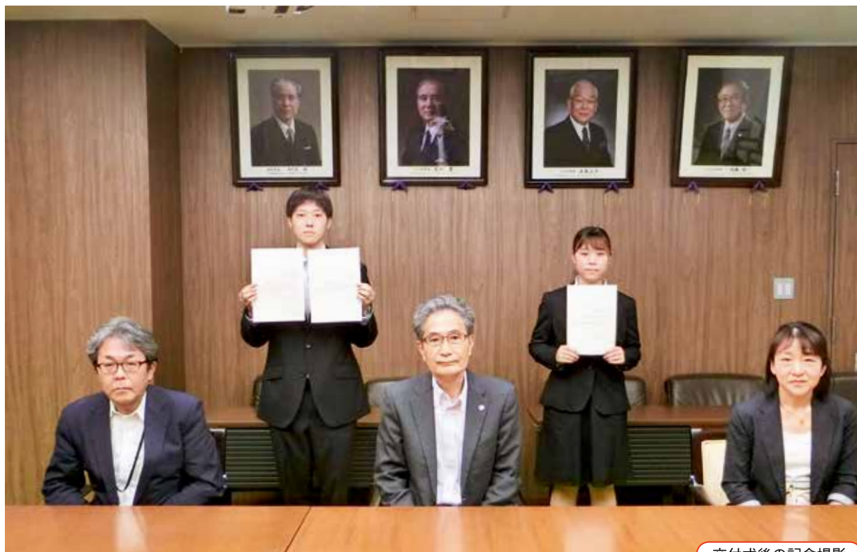
交付式後の記念撮影

交付式に続いて懇談会が行われ、各団体出席者から、新入生勧誘の状況説明や、昨年度実施できなかった一部の学外活動が今年度は実施できることが喜ばしいとの感想を聞くことができました。