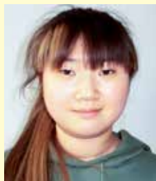
農学生命科学部 食料資源学科1年

専門を学ぶのはまだ先の話になりますが、日々の積み重ねを怠らず、有意義な大学生活を送りたいです。