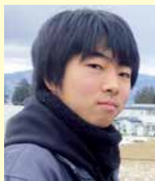
農学生命科学部 分子生命科学科1年