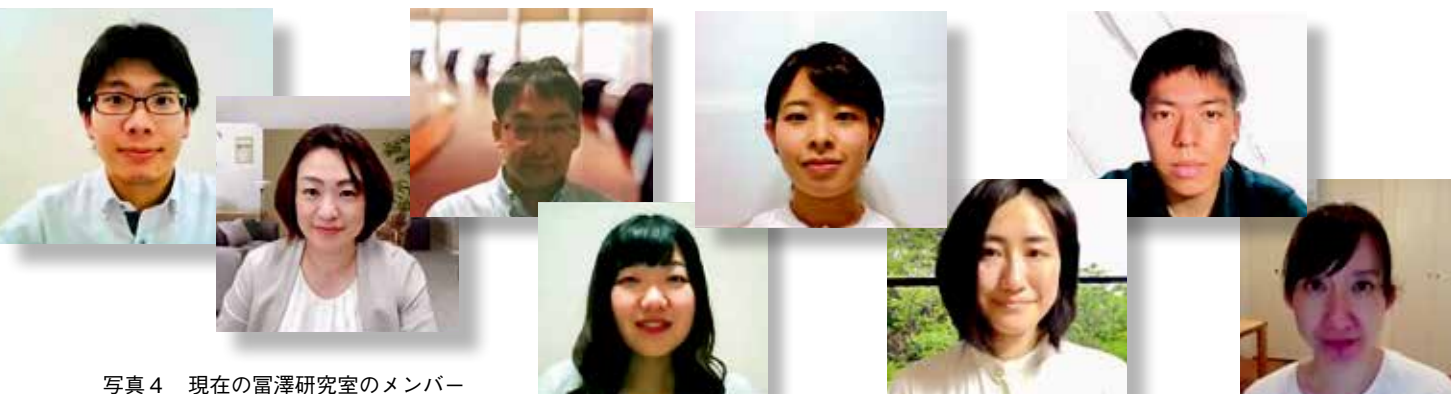
写真4 現在の富澤研究室のメンバー

看護学は、基礎研究の側面もありますが、応用の科学の側面が強いです。また携わる教育研究者の特性として共感性が重要視されます。不安定、不確実、複雑、そして曖昧で予測不可能なVUCAな時代が到来し、こうした状況では、固定観念を疑って一歩前に進む勇気とどんな状況にも柔軟に対応できる力、新しいつながりを作っていく力が必要です。弘前大学で学ぶ看護学生は柔軟でアイデアに富んでいます。その若いエネルギーで創造し、そして共感性を高め、専門や学部を超えて、また地域とリンクしてより新しい教育や看護を見出していきたいと思っています。デジタルトランスフォーメーションが進み、地球規模で同時にいろいろな情報を得ることができるようになりました。地方に住んでいても、全国、世界に発信できることをコロナ禍において特に実感できるようになりました。東北出身の方、特に青森出身の若い人たちは、東京など都会に思いを寄せ、地元になかなか残らない状況にあります。しかし、青森に残っていても、若い人たちが活躍できる場所はありますし、色々なことに関わりながら、自分たちでアイデアを出し動いていくことで世界に向けて発信できます。前に進む若い学生の皆さんをこれからも応援していきたいと考えています。