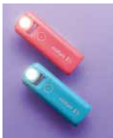
写真3 共同開発した巡視ライト

医療現場には様々な課題がありますが、医療職の皆様は経験と工夫で日々の実践を行ってくださっております。現場での問題解決のために看護研究を行っていきませんが、工夫だけで課題解決できない場合、企業が持っている様々な技術やノウハウを応用して解決していくことが可能です。2年前に看護師の研究指導の際に「夜間巡視で使うライトで創部をみると白く反射してしまってちゃんと観察できないので困る」といった発言があり、刻一刻変化する微妙な患者様の状況を観察できずに困っていることがわかりました。どうしてもそのことが引っ掛かったので、実際にライトを購入して確かめると同時に、多くの看護師の意見を取りまとめると同様の意見がありました。さらに手元がぶさらないほうが良いとか、照度を変えられる方が良いとか、充電式が良いとか、いろんなニーズが出てきました。ニーズを満たす製品を作ることが現実的に可能か当時共同研究をしていた地元企業の方に相談してみました。やれるかわからないけれどもやってみましょうとのお返事をいただき、開発がスタートしました。試作品を作り、臨床現場で使ってもらい、見え方や使い勝手、他製品との違いについて比較しながら、そ