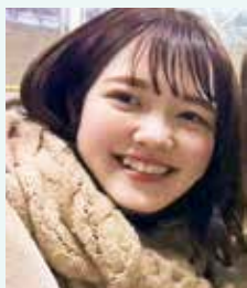
農学生命科学部 食料資源学科3年

未だ生活に不自由が残り大変な時期が続くと思います。身の安全を第一に気を付けつつ、勉学に励んでください。心より応援しています。