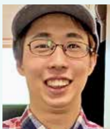
農学生命科学部 国際園芸農学科3年

1年生の皆さんには、今のうちにやりたいことを存分にやってほしいです。このご時世なので外へ出ることには抵抗があるかもしれませんが、探してみると今でもできることがたくさんあります。私が特にやってあげばよかったと思うことは、資格の勉強です。幅広い分野に役立つ資格はたくさんあるので、決して無駄にはならないと思います。勉強だけではなく、もちろん部活やサークル、友達との遊びは思う存分楽しんでほしいです！