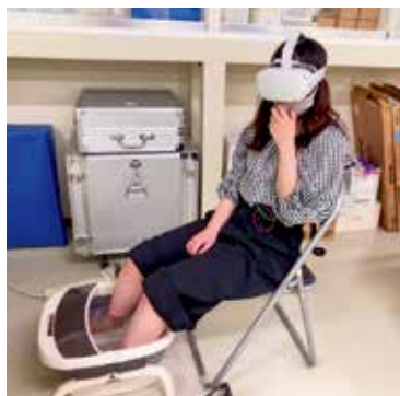
写真2 足浴におけるVRの効果検証中

した。これまでは眼科の緊急手術を行う患者の手術までの体験ができるVR教材を作成し、医療を目指す学生への教育効果について検証しました。患者体験をすることで必要な言葉がけや指導が明確になってきます。現在も患者にとって最適なケア環境を検討するためにVRを作成しその効果を検討したり、VRを用いた臨場感のある体験型の看護教育プログラムを開発をしています。写真は4年生の卒業研究の一場面、VRを用いた足浴の効果を見ている場面です。対面でしか得られない経験と対面でもなくとも経験できることを模索しながら教育や医療にとって最適なものを検証していきたいと考えています。