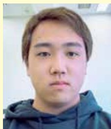
理工学部 機械科学科1年

でできた友人と一緒に授業を受ける中で、新しく学んだことについての疑問点や自分の興味があることを話すのが楽しいと感じることが多くありました。自分の知らないことを学び、理解し、それを使って自分で何かをするということは、新しいものを手に入れた時と同様に楽しいです。私は興味を持つ分野が文系・理系や学問において多方面に及ぶことがあるため、幅広い学問を学べる弘前大学に入学して良かったです。これから四年間で、大学生活を楽しむだけでなく多くのことを学んで身につけ、卒業時に「最高だった。」と思えるような大学生活にしたいです。