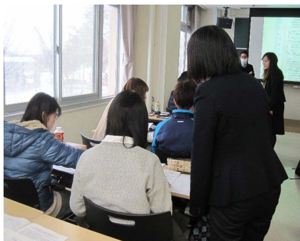
ノートテイクを実践する参加者