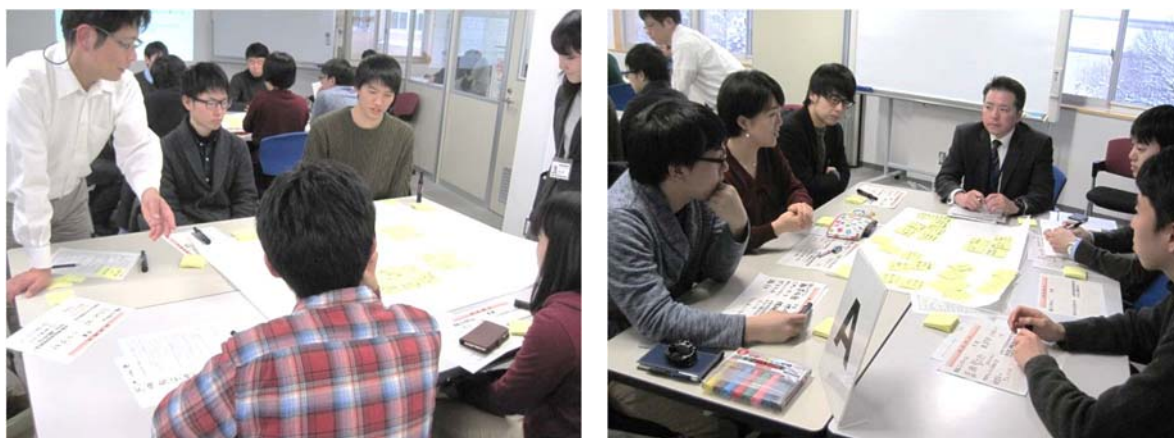
グループディスカッションの様子

参加した学生からは「このような懇談会を今後も続けて欲しい」と望む意見がありました。