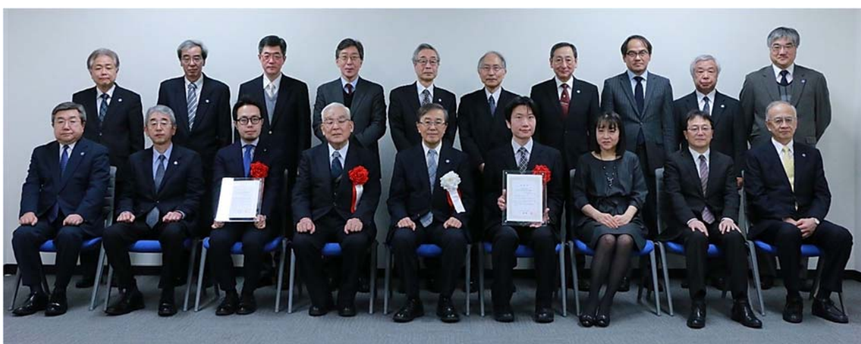
学術特別賞授与式後の記念撮影

今回の講演会には、多くの学生・教職員の参加があり、本学において高い評価を得られた論文や本学の看板となる優秀な研究成果に触れる貴重な機会となりました。