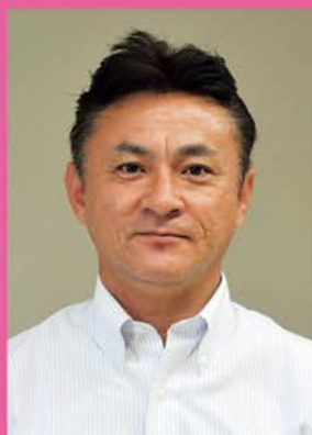
被ばく医療総合研究所 放射線物理学部門 教授/アイソトープ総合実験室長