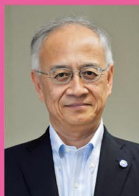
副学長(被ばく医療・COI担当)

平成21年4月 青森県健康福祉部医療業務課長 平成23年4月 青森県健康福祉部次長 平成25年4月 青森県西北地域県民局長 平成27年4月 青森県中南地域県民局長 平成28年4月 弘前大学放射線安全総合支援センター事務局長