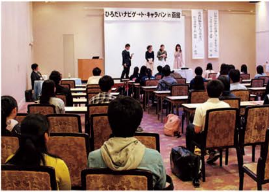
体験談を話す弘前大学の学生

当日は、対象地域の各高校から170人ももの高校生、教員、保護者の参加があり、模擬講義、現役学生の体験談の聴講や、進学相談会場では学部毎に設けられたブースで学部の特徴を熱心に質問していました。高校生にとっては、大学の学びを体験し、弘前大学をより身近に感じてもらおうよい機会となりました。