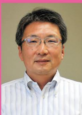
放射線安全総合支援センター事務局長/ 学長特別補佐

「以前から新たな被ばく医療体制を構築する仕事に関わりたと思っています。任命されたからには、弘前大学