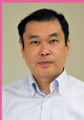
医学研究科 救急災害医学講座 教授/高度救命救急センター長

福島原発事故直後は住民の放射線被ばくによる影響を評価した。国際的には高自然放射線地域における住民の被ばくの実態調査を展開中。国際標準化機構(ISO)や国際電気標準会議(IEC)を通じて放射線・放射能測定に係る国際標準規格の策定に関与。