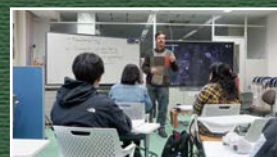
イングリッシュラウンジで生きた英語を学ぶ

入校された方にはカレッジ学生証が交付され、附属図書館、大学会館、イングリッシュラウンジなど弘前大学キャンパス内の様々な施設を利用することができ、学生と一緒にサークル活動や大学行事へも参加できます。