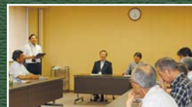
ホームルームの様子