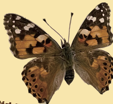
学内に生息する蝶類

博物館や美術館で働く専門的職員である 学芸員 の資格取得をめざす 学生たちが実習で展示を製作しました。その成果をご覧ください!!