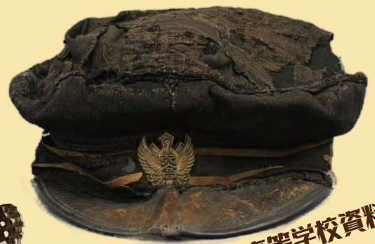
旧制弘前高等学校資料