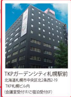
TKPガーデンシティ札幌駅前 北海道札幌市中央区北2条西2-19 TKP札幌ビル内 (会議室受付1F/宿泊受付6F)