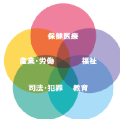
公認心理師に求められる5つの職域