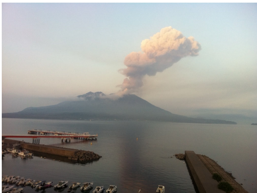
図1：現代の桜島の噴火（2011年6月）。

本研究は、スウェーデン・リサーチカウンシルのほか、科研費 基盤研究 (C)「先史巨大噴火の生業への影響に関する動物考古学的研究」[代表者：内山純蔵，分担者：栗畑光博] (科研採択番号 21K00988, 研究期間 (年度) 2021-2024), ならびに NPO 法人国際縄文学協会の支援を受けて実施されました。