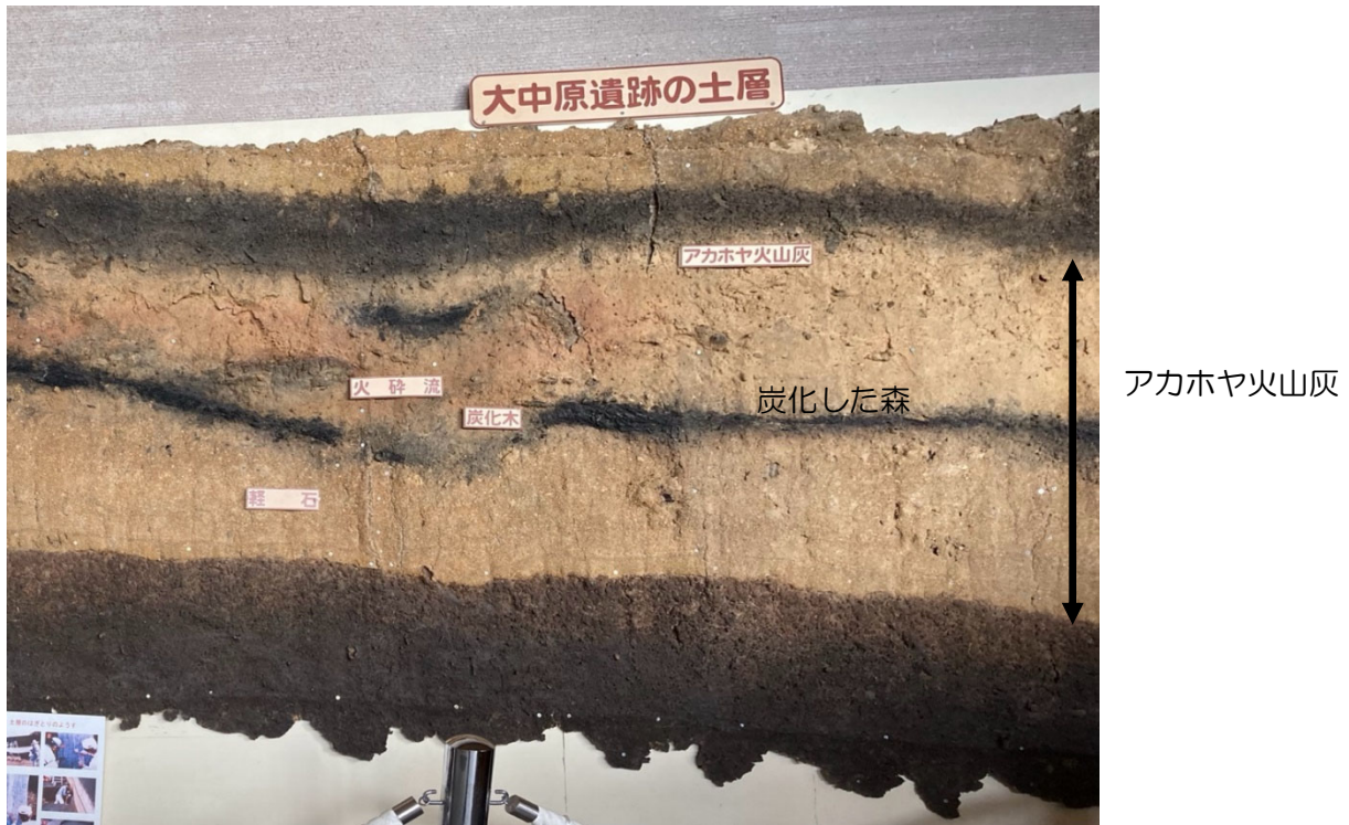
図3：鹿児島県大隅半島の大中原遺跡から検出された鬼界アカホヤ噴火の火山灰層（鹿児島県立埋蔵文化財センター玄関ホールでの展示，2022年7月）

この地点には、森が広がっていたが、まず軽石が降り積った後に高温の火砕流が襲い、森が焼き尽くされて炭化したまま残っている。